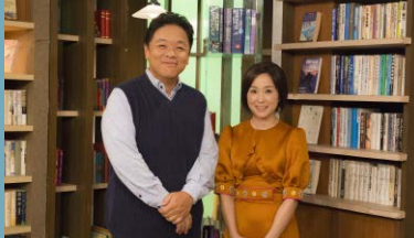
NHK100分de名著 制作スタッフ