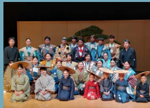
The American School in Japan 狂言クラブ