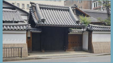
公益財団法人冷泉家時雨亭文庫