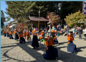
湯前町立湯前中学校 「伝統芸能継承活動」