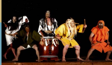
御陣乗太鼓保存会