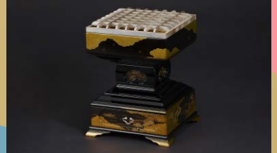
漆芸職人集団彦十時絵