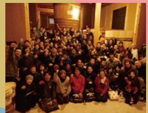
木桶職人復活プロジェクト