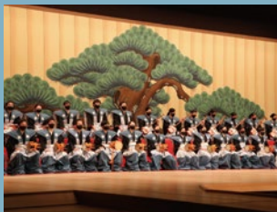
こまつ歌舞伎未来塾 (歌舞伎のまち小松の将来を担う石川県の子どもたち)