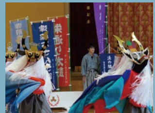
宮古市津軽石中学校 文化祭郷土芸能獅子舞グループ (大震災を超えて、法の獅子舞の復興に立ち上った岩手県の中学生たち)