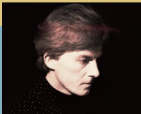
クリス・モズデル (詩人・作詞家)