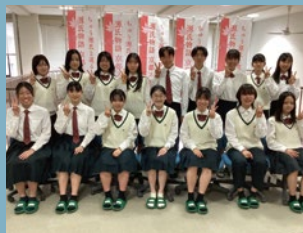
京都府立嵯峨野高等学校 京・平安文化論ラボ (京都で地域と歴史に密着した伝統文化の継承・発展活動を行う高校生たち)