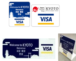
京都オリジナルアクセプタンスマーク