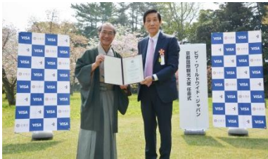
京都国際観光大使任命式