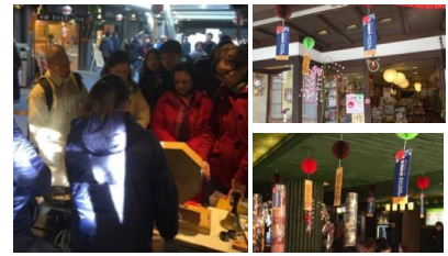
嵯峨嵐山地域での買い物キャンペーン

今後、数多くの国際的なイベントが日本で開催され、日本の魅力に触れることを期待して数多くの方が訪日されることから、Visa との協力体制を強化し、京都市内の隠れた観光スポット等への周遊に繋げる取組を展開します。